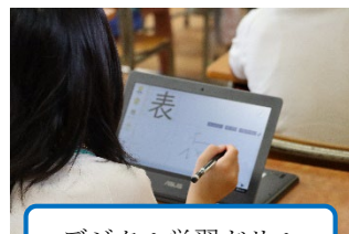
デジタル学習ドリル