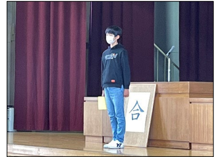
【6年生代表児童の発表】

2学期も、子供たちが成長していく姿を、様々な機会を通してお見せしていきたいと思えます。今後とも御支援をよろしくお願いいたします。