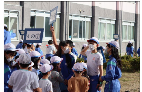
【6年生がグループをまとめます】

10月25日(火)のMAに「たてわり活動(たてわりフリー)」を行いました。「たてわりフリー」はたてわりグループの1～6年生が集まって遊びを行う活動です。今回の活動でも、各教室や校庭で笑顔で活動する子供の姿が多く見られました。その中でも特に活躍が見られたのが6年生のなずな学年です。1年生のお迎えからグループ全体への整列指示、活動内容の説明やルールの確認など、最高学年としててきぱきと活動を進めている様子が見られました。