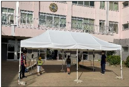
登校時に昇降口前で使用しています

新型コロナウイルス感染防止対策の一つとして、毎朝の登校時に昇降口前で検温を行っています。これまでは非接触型の手持ち体温計を使用していましたが、PTA会費より購入させていただき、非接触検温計(サーマルカメラ)を3台導入いたしました。以前に比べ、登校時の検温もスムーズに行うことができます。様々な面で支えられていることに感謝をしながら、今後も感染防止対策を徹底していきたいと思えます。