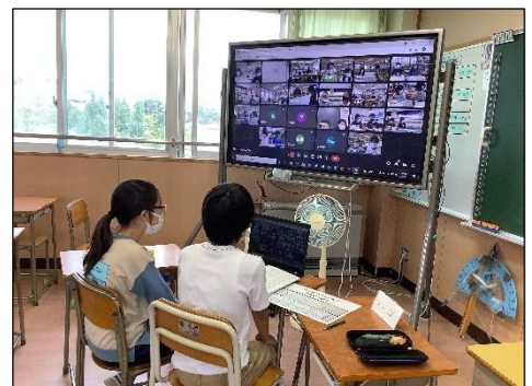
各教室の電子黒板には、全参加者の様子が映ります