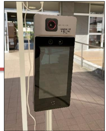
7インチの見やすい大画面