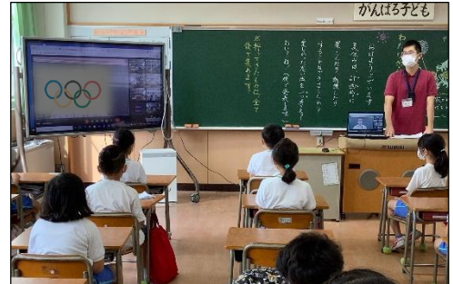
【各教室で集会に参加しました】

33日間の夏休みを終え、今週から子供たちの元気な声が学校に戻ってきました。オンラインで実施した夏休み明け全校集会では、教頭先生が、今夏に実施された東京オリンピックの様々な場面を取り上げながら、「分かち合う」をキーワードにお話をされました。