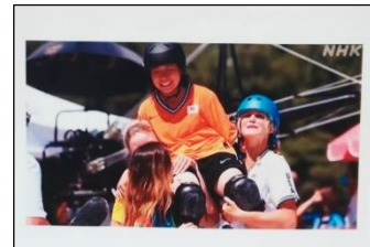
【互いに称え合う様子】

オリンピックのシンボルマークである五つのリングに込められた意味や思い、そして、競技を終えた選手たちが互いの健闘を称え合う様子から「分かち合う」ことを学び、学校生活の様々な場面でも互いに「分かち合う」ことを大切にしていってほしいとお話をされました。様々な活動に制限がある中ではありますが、子供たち同士の関わりの中で「分かち合う」ことを大切にしながら、夏休み明けも充実した学校生活を送ってほしいと思います。