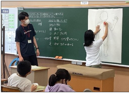
【黒板で示すものの大きさも工夫して】