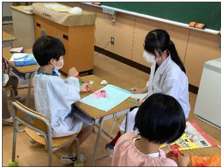
【子供の目線に合わせて話をします】

6月14日（月）から前期教育実習が始まり、104名の学生が教育実習生として2週間の実習を行いました。