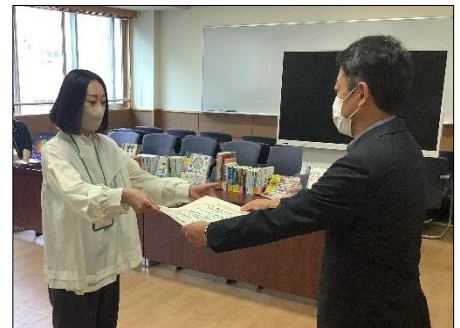
【西城校長が代理で表彰式を行いました】

今年度も学習環境サポート委員の皆様を中心に、ベルマーク収集に取り組む予定です。子供たちの学習環境の充実に向けて、保護者の皆様の御協力をお願いします。