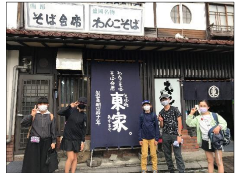
【わんこそばを味わったグループもありました】

研修旅行は、小学校生活の中でも思い出に残る大きな行事の一つです。歴史に学び、文化に学び、人に学び充実した研修となったようです。ぜひ、この学びを今後の生活の様々な場面で生かして欲しいと思います。