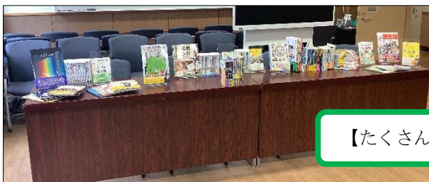
【たくさんの図書が寄贈されました】