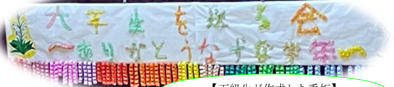
【下級生が作成した看板】