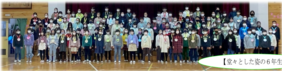
【堂々とした姿の6年生】

3月も半ばとなり、いよいよ本年度を締めくくる時期になりました。6日（月）には5年生けやき学年が中心となって「6年生を送る会」を行いました。本来であれば体育館に全校が集まって実施する「6年生を送る会」ですが、全体の会は5年生が代表として体育館で6年生を迎え、その他の学年はオンラインで参加しました。画面越しではありましたが、6年生からの言葉や歌声に真剣に耳を傾ける子供の姿が見られました。その後は各たてわりグループがそれぞれの活動教室に集まり、グループで作成したメッセージカードを6年生に贈り、顔を合わせて感謝の思いを伝えました。1年間、附属小学校のリーダーとして学校を引っ張ってきたなずな学年の子供たち。20日（月）の卒業式では、凛々しい姿を見せてくれることでしょう。