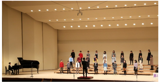
【素敵な歌声が響きました】

特に6年生にとっては今回が小学校生活最後の合唱の会となりました。6年間の集大成として取り組んだ学級合唱では、どの学級も曲想を豊かに表現した最高学年らしい歌声を響かせました。また、他の学年の子供たちもそれぞれの学級で取り組んできた練習の成果を存分に発揮することができました。合唱の会を通して培った力が、これからの学校生活に大いに生きてくることと思います。今後とも、本校の教育活動への御理解と御協力をよろしくお願いいたします。