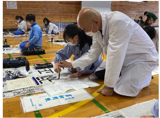
【副校長先生からも教えていただいています】

日常から美しく整った字を書こうとする意欲を高めるとともに、これまでの書写学習の成果を発揮する場として、「校内書きぞめ展」に向けた取組を行っています。低学年では硬筆に、中・高学年は毛筆を中心に取り組んでいます。毛筆では、副校長先生からも直接教えていただきながら一画一画を丁寧に、集中して取り組む姿が見られています。「校内書きぞめ展」は1月15日（土）～21日（金）に実施します。書きぞめ展に向けて、冬季休業中も、御家庭で励んでほしいと思います。