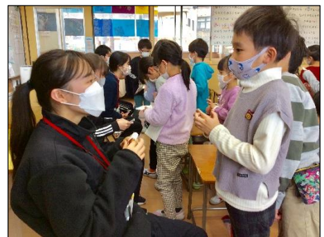
【感謝を伝えてお別れしました】

朝の時間や休み時間に校庭で一緒に遊んだり、授業実践の中で分かりやすく教えようと工夫したりと、子供たちのために一生懸命に取り組む実習生の姿がありました。また、子供たちもその姿に応えようと一生懸命に取り組みました。実習生の皆さんには、夢に向かってこれからも頑張ってもらいたいと思います。