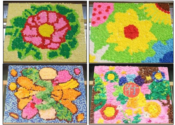
【各組集団で制作した「たてわり全校制作」】

芸術の秋にふさわしく、附属小学校全体で多くの作品を鑑賞することができる「アートフェスティバル」になりました。