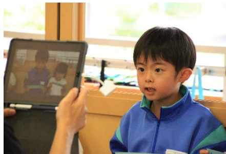
【まっすぐ見つめて自己紹介】

1年生も名前をはっきりと伝えて自己紹介をし、画面の向こうにいる“おにいさん”“おねえさん”と出会いました。実際に顔を合わせる活動はまだ先ですが、全校が同じ時間を共有するという有意義な会となりました。