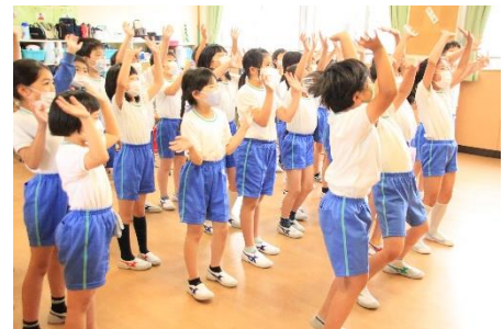
【身振り手振りで大歓迎】