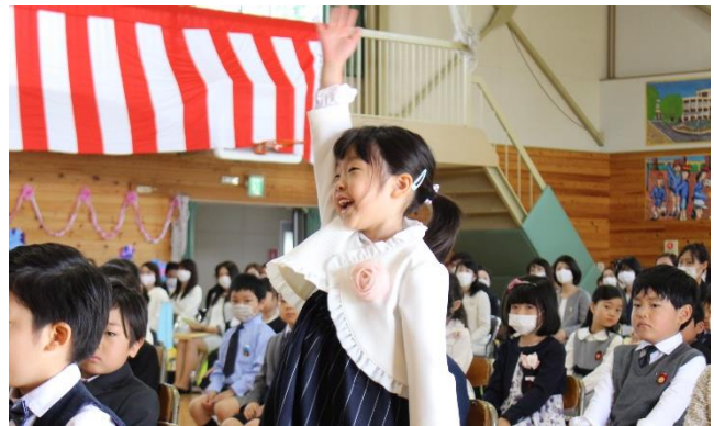
【120名の元気な返事が響きました】

番号ごとに登校日を設けていましたが、各学級で全員の子供が揃うのは4月8日以来です。最初は緊張した雰囲気もありましたが、子供同士や担任との関わりを通して、楽しく和やかな様子で過ごしていました。明日からの生活の中で、更に仲を深めていってほしいです。