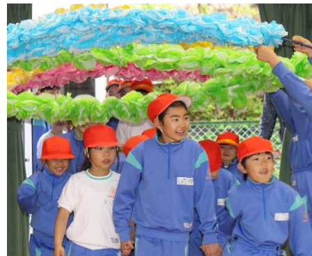
【6年生と入場した1年生】

これから1年間、このたてわりグループで遊びや清掃などの活動に取り組みます。異年齢集団での活動を通して、子供たちが成長していけるようにサポートしていきたいと思ひます。