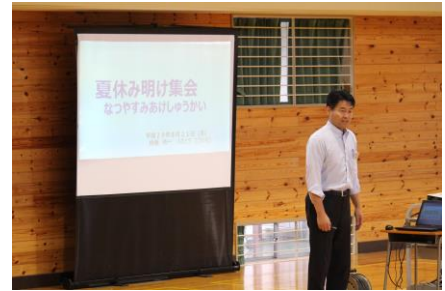
【教頭先生のお話：夏休みを振り返って】

これから1学期のまとめの時期となります。年度当初に立てた目標を振り返り、自分は何のくらい努力をしたのか、心や体がどれだけ成長したのか考えながら生活していきます。10月6日の第1学期終業式まであと28日。充実した毎日を送ることができるよう、指導し励ましていきたいと思えます。今後とも御支援をよろしくお願ひします。